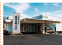
五戸店(報恩会館五戸館内)

〒031-0812 青森県八戸市湊町字柳町1-8 TEL 0178-34-5968 営業時間 8:45~17:00 営業日 元日以外年中無休